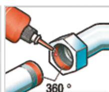
Etanchéité des filetages