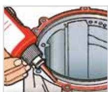
Etanchéité des plans de joints