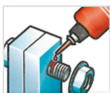
Freinage des filetages