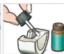
Préparation de surface