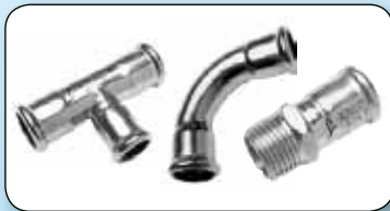
Raccords à sertir