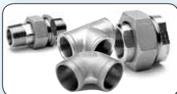
Raccords et accessoires de tuyauterie