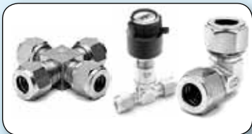
Raccords double bagues