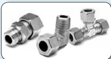
Raccords simple bague