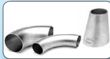
Accessoires à souder