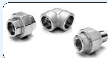
Raccords série 3000